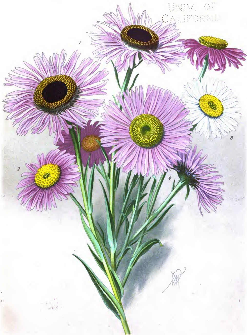
Aster diplostefioides (1.); A. alpinus var. superbus (2.); A. alp. var. albus (3.) et A. peregrinus (4.).